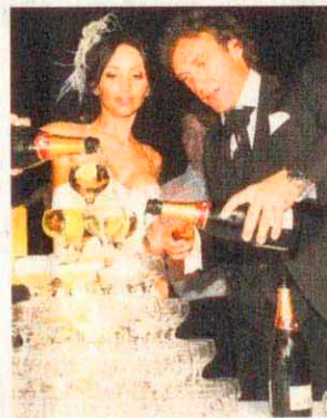
Um Mitternacht servierte das dolle Paar den Gästen Champagner